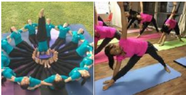
ดูแลสุขภาพ

ส่งเสริมการปรับปรุงพฤติกรรมมารับประทานอาหารและการออกกำลังกาย โดยผู้ฝึกสอน สัปดาห์ละสองครั้ง นอกจากนั้นยังมีการตั้งกลุ่มสำหรับ พนักงานในการท้าทายความแข็งแรงของร่างกายและแลกเปลี่ยนเคล็ดลับ เพื่อการบรรลุเป้าหมายในการ