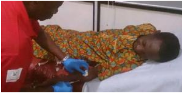
พนักงานเมก้าเข้าร่วม กิจกรรมบริจาคเลือด

เพื่อเป็นการร่วมเฉลิมฉลองวันบริจาคโลหิตโลก บริษัทฯ ได้เชิญศูนย์ บริการรับบริจาคโลหิตแห่งลากอส มารับบริจาคโลหิตที่สำนักงานเมก้า พนักงานที่มีความประสงค์จะต้องได้รับการคัดกรองก่อนที่จะบริจาคโลหิต